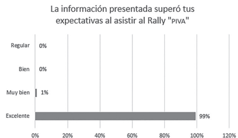
Gráfica 2. Expectativas sobre el PIVA—estrategia masiva.

Asimismo, se realizó una encuesta de evaluación sobre el programa; el resultado demuestra que en esta primera emisión las expectativas de los alumnos fueron superadas, como se evidencia en la Gráfica 2.