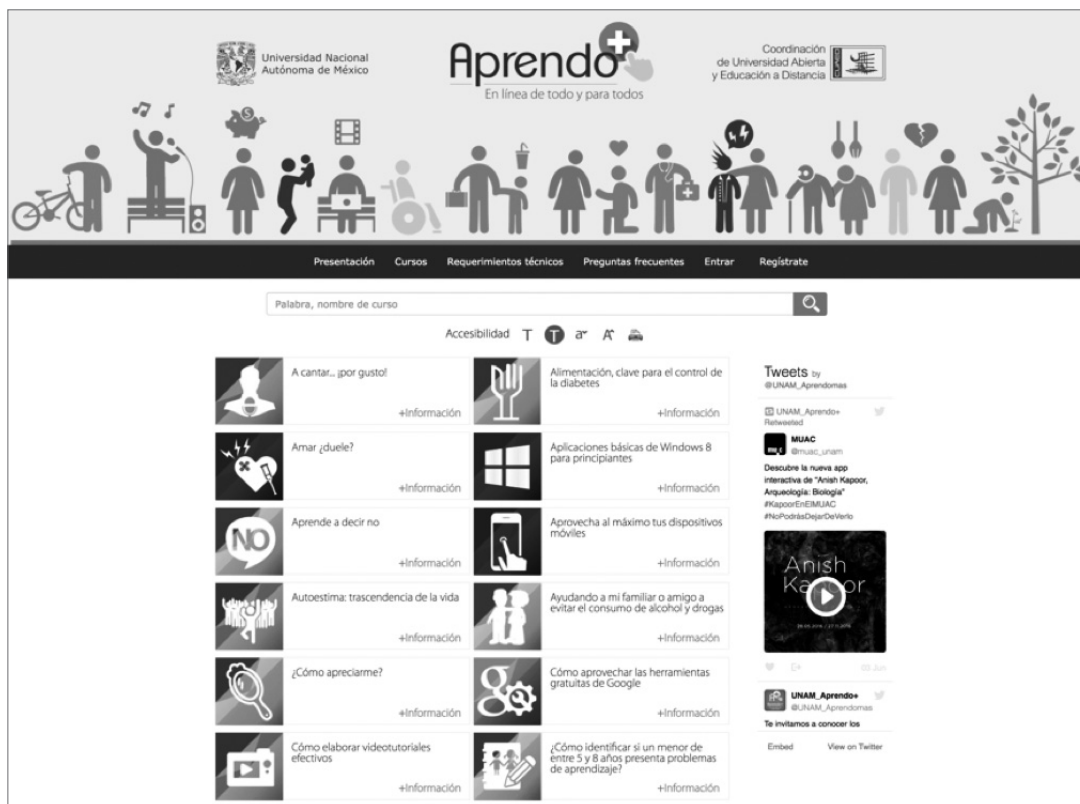
Figura 1. Portal Aprendo+